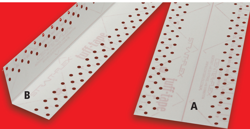
A – Podstawowe zastosowanie: do płaskich połączeń B – Dodatkowe zastosowanie: do narożników wewnętrznych